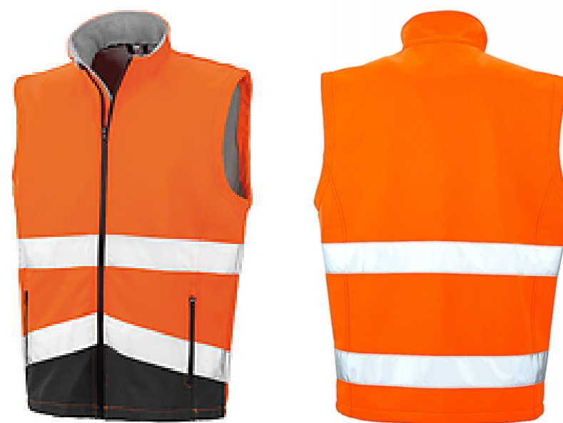
Farbe: orange/schwarz Größen: S - 4XL