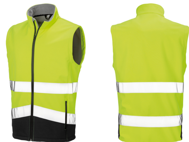
Farbe: gelb/schwarz Größen: S - 4XL